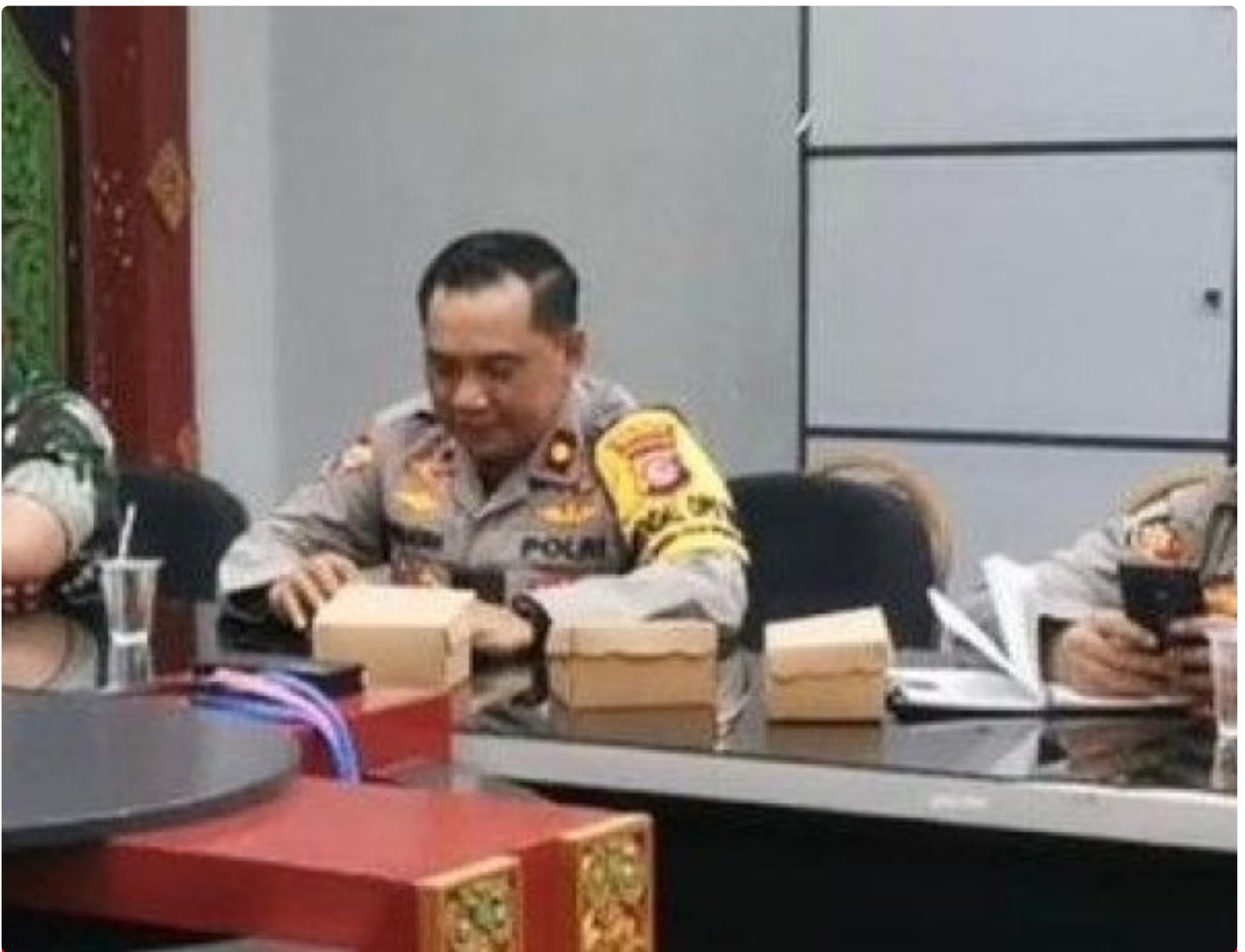
Kabagops Polresta Mataram saat menghadiri Rakor di Kantor Bupati Lombok Barat, Selasa (10/12/2024)

MATARAM, NTB – Dua tradisi budaya ikonik, Pujawali dan Perang Ketupat, akan kembali digelar di Pura Lingsar, Kecamatan Lingsar, Kabupaten Lombok Barat. Persiapan event tahunan ini kian dimatangkan oleh Pemerintah Kabupaten Lombok Barat melalui Dinas Pariwisata Lombok Barat dengan mengadakan rapat